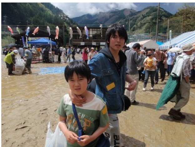
おまつりの会場はぬかるんでいて、「田んぼ」と呼ばれちゃいました。

昨年度は震災の影響もあり中止となった「多摩源流まつり」。今年は天気には恵まれませんでした但予定どおり開催されました。本会も「むらまつりキャンプ」の中で、お祭りの会場を訪れました。夜には雨も上がり、お松焼き、打ち上げ花火を楽しむことができました♪