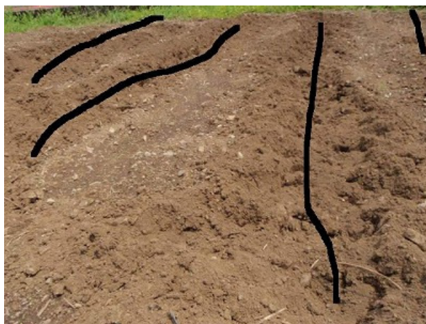
新しく畝を作ったかのように、きれいに掘り返していきますな。

相変わらず、畑の獣害は多いようです。今シーズン既に、畑に植えたジャガイモを掘り返されたというお話を数件聞いています。そして、「むらまつりキャンプ」でみんなで植えた INCH のジャガイモも、半分ぐらいイノシシに掘り返されてしまいました・・・、悔しいっ～！