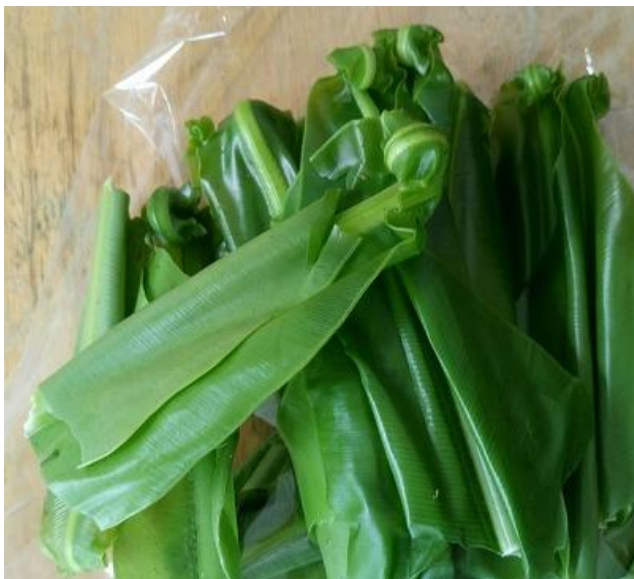
(上の写真の植物の穂先)