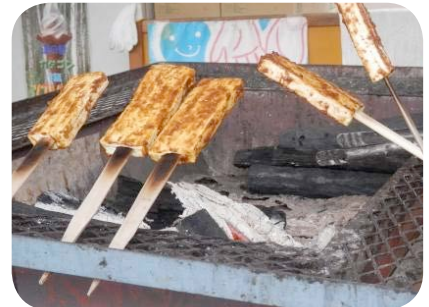
道の駅白樺の里やまがたの豆腐田楽