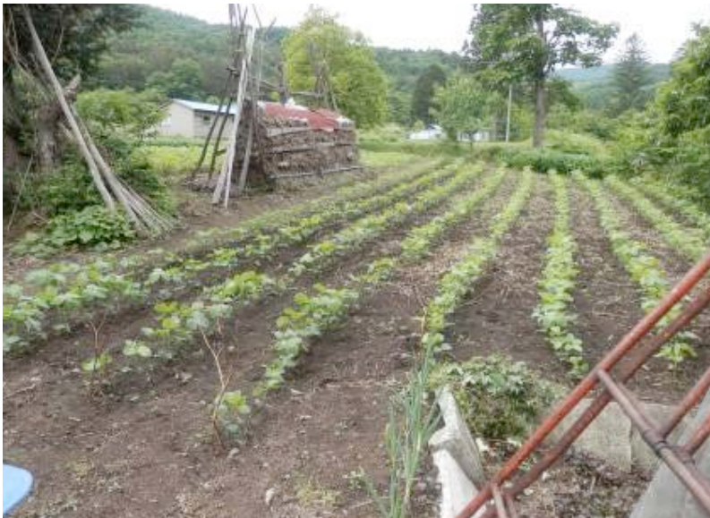
▲写真6 Nさんのダイズ畑