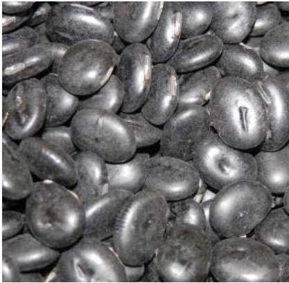
▲写真1 山根でとれたクロマメ (新山根温泉べっぴんの湯に展示されていたもの)

「ごど豆」はクロマメでつくる保存のきく副菜である。秋にクロマメが収穫できると、その豆をやわらかく煮て、「こうせん」か、「きな粉」をまふし、トウカに入れて囲炉裏の上などで乾燥させバラバラにする。4・5日でハナ（麹菌）が来る。それ以上待ってもハナが来ないと納豆のようにねばついてしまう。できた「ごど豆」は塩水を煮て冷ましたものに入れる。何日か経った方がどろっとして美味くなる。ダイコンおろしに入れても美味しい。クロマメはダイズより甘みがある。ダイズより、少し早めに作付けするが、ハトの被害が多い。クロマメの種類は多く、すべて「ごど豆」に向く。夏前には食べきるようにする。