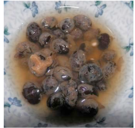
▲写真3 塩水でつけたごど豆 (写真1と同様)