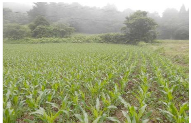
▲近隣に広がるデントコーン畑