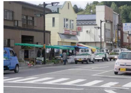
▲写真4 久慈の市日の様子