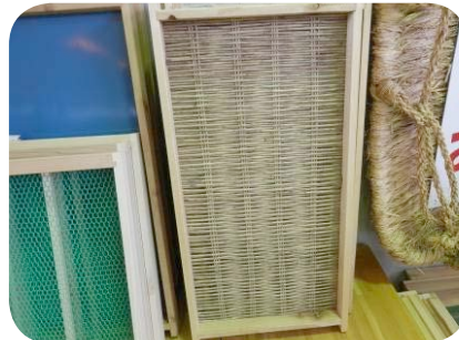
道の駅白樺の里やまがたで販売されていた 木と竹で作られた「トーカー」