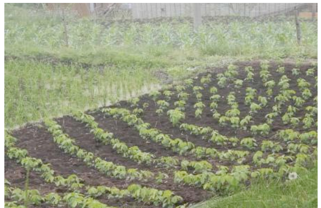
▲田とデントコーン、ダイズ畑