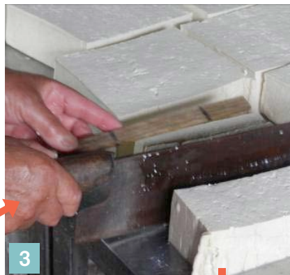
3 包丁で長方形に切り分ける。