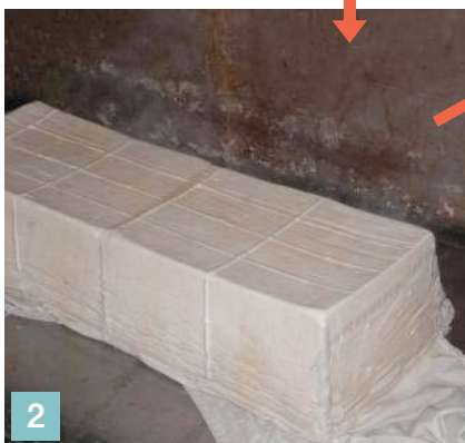
2 型から取り出された豆腐