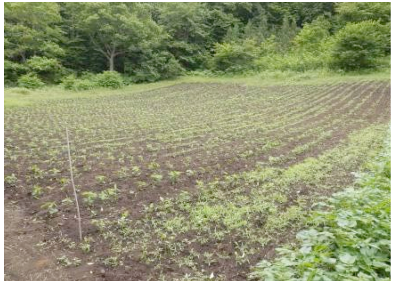
▲写真7 近隣のダイズ畑 約2反