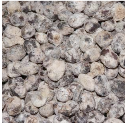
▲写真2 ごど豆 麹状のもの (写真1と同様)