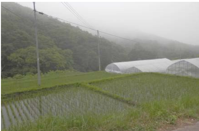
▲久慈市山形町の水田

現在栽培しているダイズは自家採種しており、家族が好きなので、月に3回は豆腐を作る。近所から手作りの豆腐をもらうこともある。豆腐が無いと食卓が寂しく感じるという。