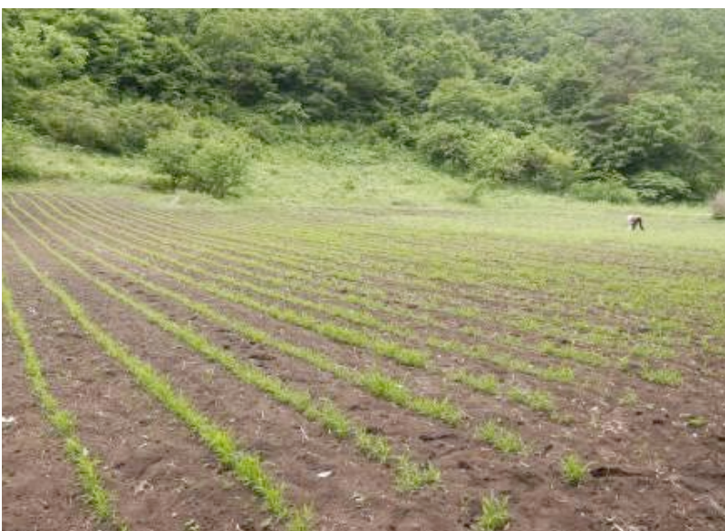
▲写真8 近隣のアワとヒエの畑 約2反