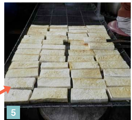
5 網にのせて落ち着かせる。味噌をつけて再度焙る。