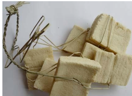
▲写真3 久慈の市日で販売されていた凍み豆腐(写真1と同様)

凍み豆腐は、豆腐田楽よりやや薄めに切った豆腐を、寒中に屋外で凍らせてつくる。煮物や味噌汁に使う。