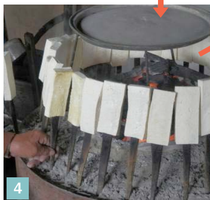
4 炭火で水分を飛ばし焦げ目をつける。