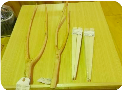
道の駅白樺の里やまがたで売られていた マメを叩く「マドーリ」と豆腐田楽の串