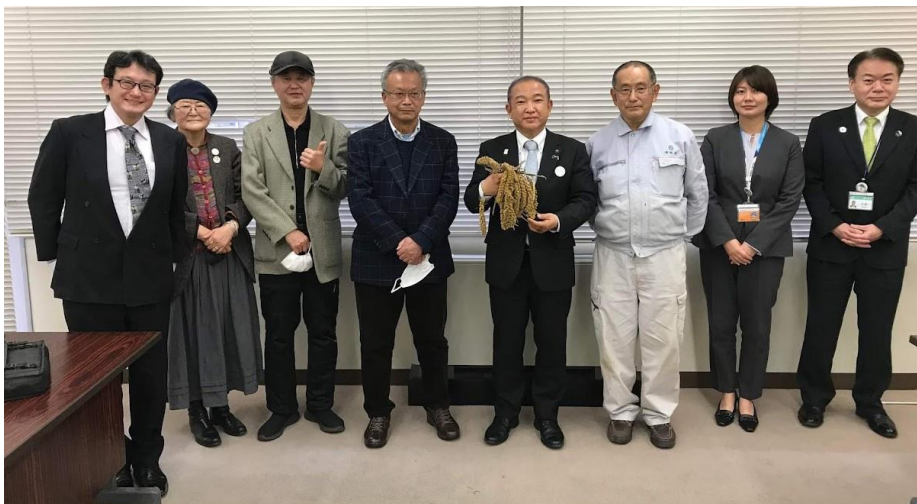
相模原市長訪問（2023. 2. 8）