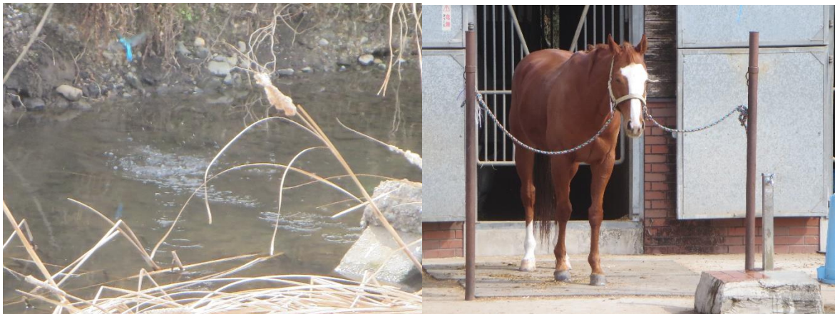
カワセミ 東大馬術部の馬